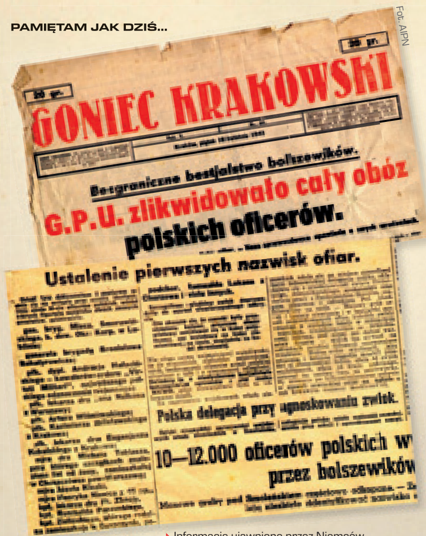
► Informacje ujawnione przez Niemców w polskojęzycznej gadzinówce

temu Polska usłyszała, że powstały obozy jeńców w Starobielsku, Ostaszkowie – tam gdzie byli przetrzymywani policjanci – oraz w Kozielsku. Sztuką było w tych pięciu czy sześciu zdaniach zawrzeć to wszystko, co chcieli przekazać się bliskim, że się ich kocha i o nich pamięta, żeby nie tracili nadziei”.