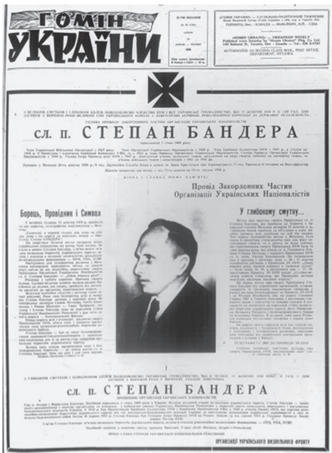
1. Fotografia okładki książki autorstwa Manolyo'ego R. Lupula, The Politics of Multiculturalism. A Ukrainian-Canadian Memoir (Edmonton i Toronto 2005).

Analyzing the Bandera cult in Edmonton I tried to elaborate on how the politics of multiculturalism that were introduced in Canada in 1971 corresponded with the neo-fascist tendencies of the Ukrainian radical right groups. Furthermore I tried to find out why Ukrainian radical right émigrés welcomed the politics of multiculturalism and how they used them for the process of cultivating their radical right and neo-fascist cultural activities.