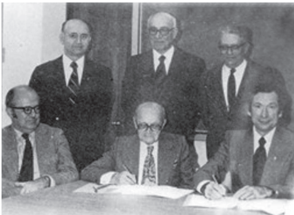
3. Pierwsza strona pisma „Homin Ukrajiny”, 24 III 1959.