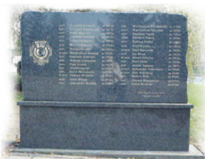
► Tablica z nazwiskami 32 żołnierzy 1. Dywizji Piechoty, którzy zginęli w Podgajach