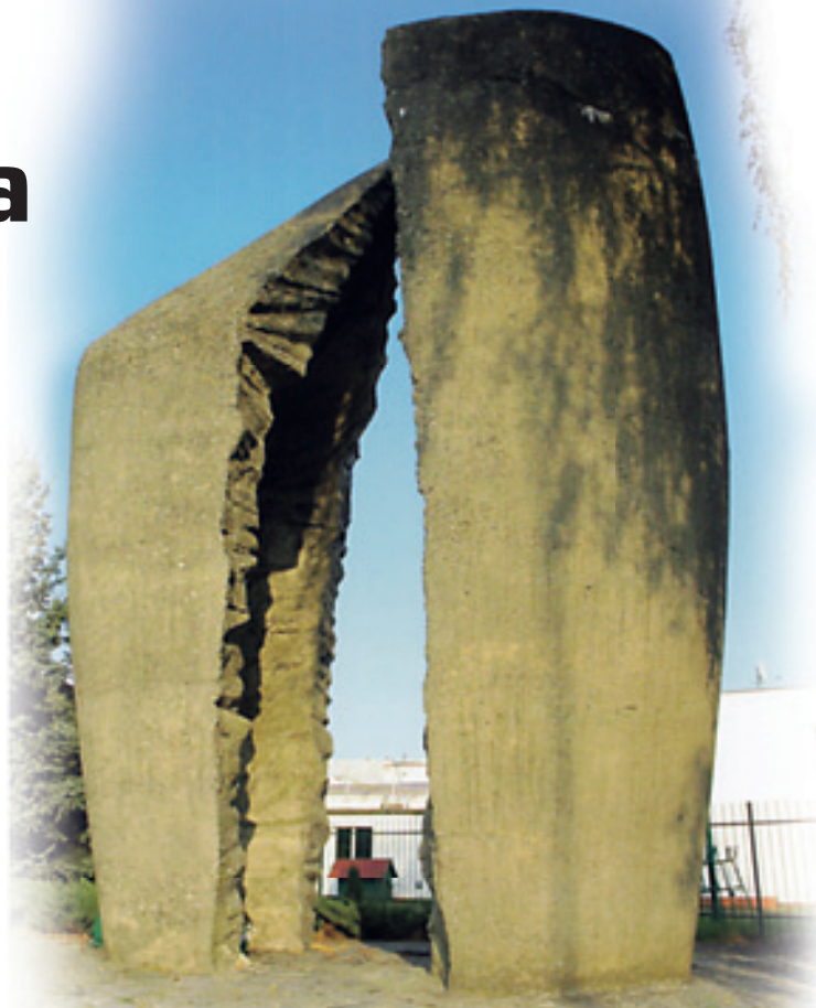
► Pomnik upamiętniający żołnierzy polskich zamordowanych w Podgajach w 1945 roku