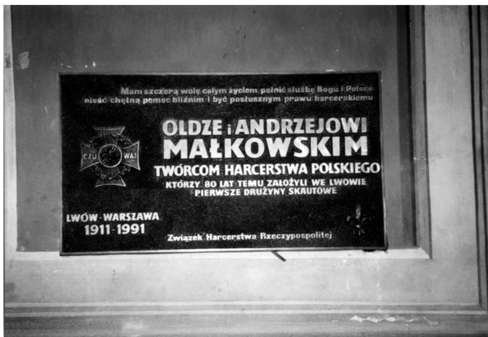
Tablica w rzymskokatolickiej katedrze lwowskiej

skazuje go na 24-godzinny areszt domowy, o którego terminie zadecyduje komendant szkoły żołnierskiej. Jako rehabilitację Sąd nakazuje żołnierzowi nr 14 przetłumaczenie dzieła pod tytułem: Scouting for boys do 15 kwietnia br. i nadesłanie tegoż na ręce dziesiątnika nr 18. Członkowie Sądu Wojskowego: nr 9, nr 18, nr 31. Lwów, 15 marca 1910 roku” 3 .