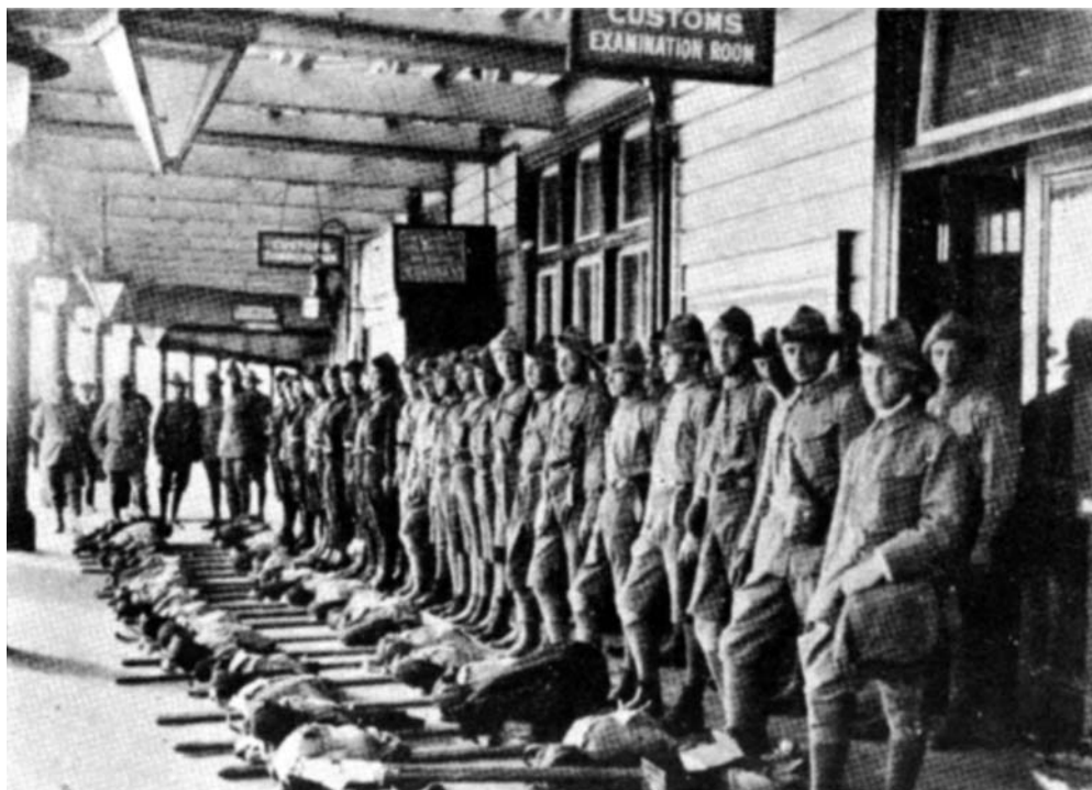
Drużyna polska na dworcu w Folkestone