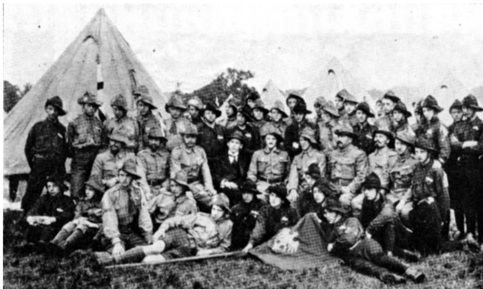
Drużyna polska w obozie pod Birmingham.

Andrzej Małkowski, zainspirowany ideami skautowymi, planował zaadaptowanie do polskich warunków propozycji Baden-Powella. Przede wszystkim bardzo mocno zakorzenił polski skauting w patriotyzmie i dążeniu do niepodległości.