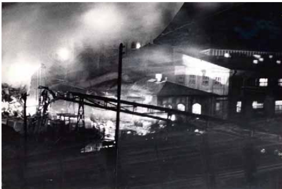
Budynek dekstryniarni w czasie pożaru