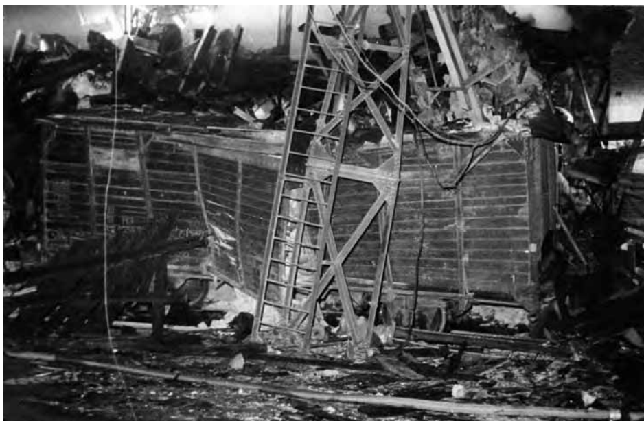
Zniszczony budynek dekstryniarni (AIPN Po, 04/3280, t. 2)