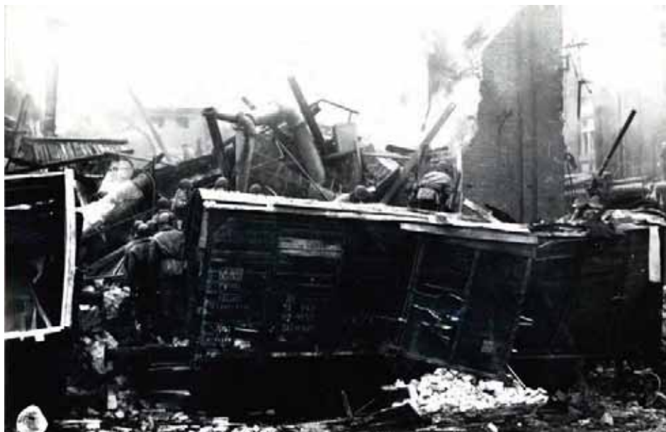
Zniszczony wagon kolejowy na bocznicy przy dekstryniarni (AIPN Po, 04/3280, t. 2)