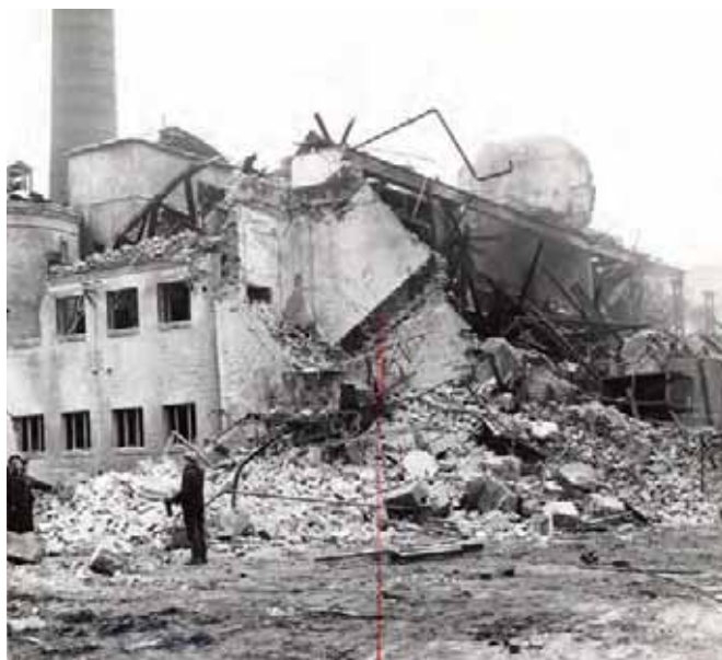
Rozbite wagony kolejowe przy dekstryniarni (AIPN Po, 04/3280, t. 2)