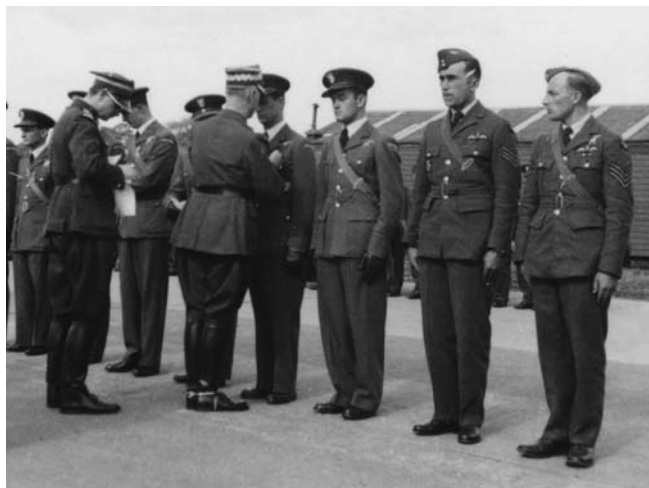
Historyczna chwila w Northolt 18 września 1940 r.; po raz pierwszy w tej wojnie polscy żołnierze są dekorowani za zwycięską kampanię

W Bitwie o Anglię walczyło 145 polskich pilotów, służących w jednostkach brytyjskich oraz w polskim 302. i 303. Dywizjonie. W okresie największego nasilenia niemieckich nalotów Polacy stanowili 13 proc. liczby pilotów myśliwskich pierwszej linii, a w październiku 1940 r. (wskutek wielkich strat poniesionych przez RAF) aż 20 proc. Trzeba przy tym podkreślić, że wkład polskich pilotów był większy niż tej samej liczby pilotów brytyjskich, jako że Polacy mieli wszechstronne wykształcenie i doświadczenie bojowe z walk w Polsce i we Francji (jednego i drugiego brakowało młodym pilotom brytyjskim rzucającym do walki wprost po