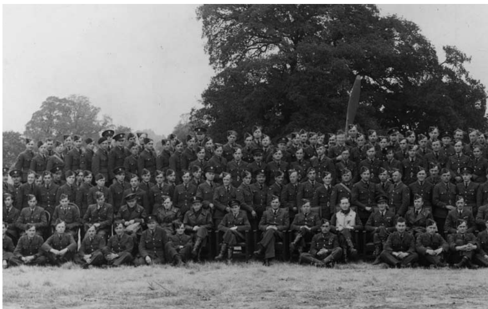
Formowano cudzoziemskie dywizjony, w których skład wchodziło kilkudziesięciu pilotów oraz kilkuset mechaników

cych dla osłabionego Albionu niebagatelną siłą. W obliczu zagrożenia niemiecką inwazją Brytyjczycy wykazali skłonność do kompromisów: uznali suwerenność Polskich Sił Zbrojnych (a w ich ramach i Polskich Sił Powietrznych) oraz zgodzili się na formowanie jednostek innych niż bombowe. Wobec zagrożenia niemieckimi nalotami zaczęto pospiesznie szkolić Polaków do brytyjskiego lotnictwa myśliwskiego. Wyniki były zaskakujące dla gospodarzy. Brytyjscy instruktorzy nie spodziewali się, że będą uczyć latania doświadczonych instruktorów z Dębłina czy pilotów-oblatywaczy z polskich ośrodków technicznych. Kilka lotów z instruktorem wystarczało, by kursant wykonał loty samodzielnie, kończąc cykl szkolenia w dość krótkim czasie. Potem odbywał się kurs myśliwski, trwający od trzech do sześciu tygodni, na który składały się głównie loty indywidualne i w szyku, nauka taktyki i komunikacji radiowej. Największym problemem dla Polaków była bariera językowa. Więcej niż połowa oficerów przedwojennego lotnictwa mówiła po francusku i po niemiecku, ale tylko kilku (!) po angielsku.