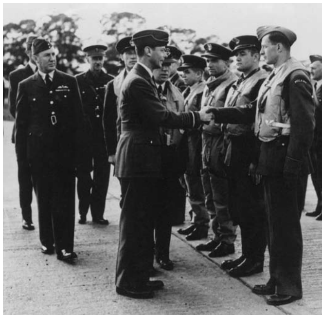
Wizyta Jerzego VI w Northolt i jego spotkanie z polskimi lotnikami miało zademonstrować Brytyjczykom, że nie są osamotnieni w swojej walce

drodze niemieckich wypraw bombowych kierujących się w tych dniach nad Londyn. Po intensywnych walkach 5 i 6 września, zwieńczonych zwycięstwami oraz okupionych stratami w sprzęcie i w ludziach, stan samolotów na wieczór 6 września był opłakany. Trzeba było nawet pożyczać maszyny zdadne do lotu ze stacjonującego w tym samym Northolt kanadyjskiego 1. Dywizjonu. Był to chyba najintensywniejszy dzień działań dla pilotów 303. Dywizjonu. Powoli wokół niego narastała legenda.