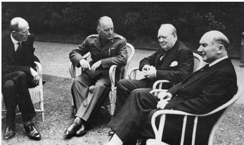
Winston Churchill ze szczególną atencją witał gen. Władysława Sikorskiego, który miał pod swoją komendą tysiące żołnierzy, marynarzy i lotników

Upadek Francji diametralnie zmienił sytuację wojenną Wielkiej Brytanii. Błyskawiczna klęska wojsk francusko-brytyjskich przegrana Polski w 1939 r. i wartość bojową jej wojska postawiła w zupełnie innym świetle, a osamotnieni w walce z Hitlerem Brytyjczycy potrzebowali sojuszników. Dlatego latem 1940 r. Churchill ze szczególną atencją witał na Wyspach Brytyjskich dwóch generałów: Sikorskiego i de Gaulle’a. Ten drugi, żywy dowód, że nie cała Francja skapitulowała, miał ze sobą jedynie garstkę rodaków chętnych do walki. Natomiast Sikorski miał pod swoją komendą wiele tysięcy żołnierzy, marynarzy i lotników, stanowią-