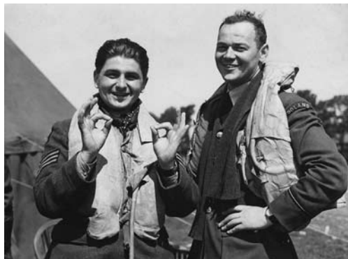
Starsi i bardziej doświadczeni polscy piloci w dywizjonach brytyjskich samą swoją obecnością wzmacniali morale młodych, świeżo wyszkolonych pilotów RAF

lotniczej Wysp Brytyjskich. Dlatego z punktu widzenia III Rzeszy celem Bitwy o Anglię było uzyskanie panowania w powietrzu nad kanałem La Manche i południową Anglią (przynajmniej po Londyn). Dodatkowo, aby miało to znaczenie praktyczne, Niemcy musieli je wywalczyć przed nadejściem jesiennej pogody, stanowiącej przeszkodę w inwazji.