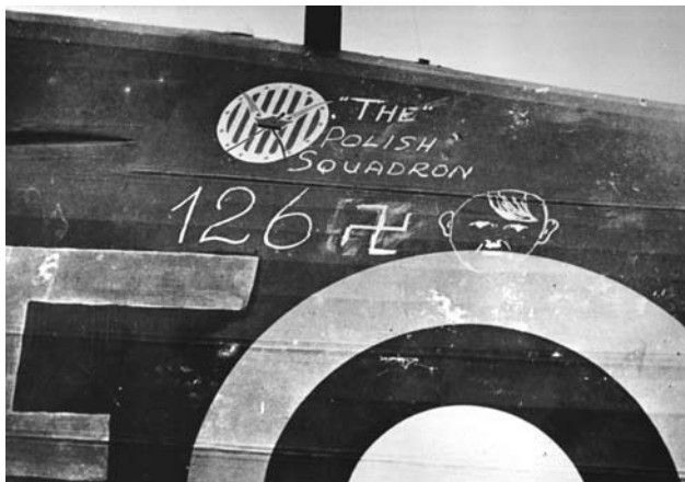
Według instytucji brytyjskich zajmujących się weryfikacją zgłaszanych zwycięstw, Dywizjon 303 miał najwięcej zaliczonych zestrzeleń ze wszystkich jednostek walczących z Niemcami

Obrona myśliwska w praktyce ograniczała się do myśliwców Supermarine Spitfire i Hawker Hurricane; było to około pięciuset samolotów zdolnych do startu na alarm oraz około