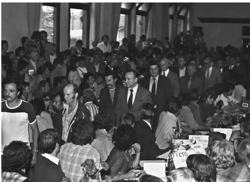
Powyżej: delegacja rządu pod przewodnictwem wicepremiera Mieczysława Jagielskiego przybywa na rozmowy do sali BHP; poniżej: wicepremier Jagielski wychodzi z sali BHP po zakończonych rozmowach z Prezydium MKS

Zabiegi SB okazały się bezowocne, nie udało się rozbić jedności strajkujących. W sierpniu 1980 r. zrealizowano cel – powstanie niezależnych od władz związków zawodowych 57 .