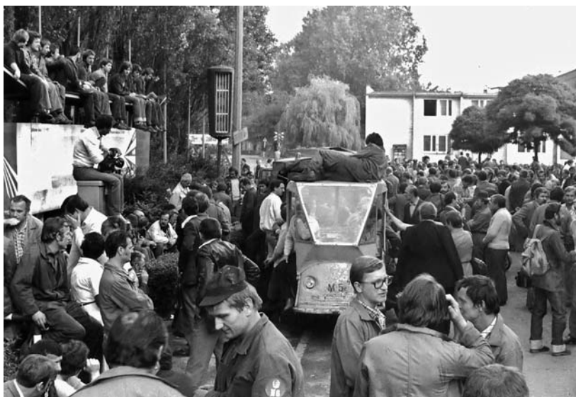
Strajkujący stoczniowcy na placu przed budynkiem dyrekcji... ... i pod salą BHP przysłuchują się obradom

W samej Stoczni – zgodnie z wcześniejszą umową – Borowczak i Prądzyński rozpoczęli agitację o 5.30. Na dużym Wydziale K-3 Prądzyńskiemu pomagał Kazimierz Kunikowski. Bogdan Felski się spóźnił 6 . Zaraz po 6.00 pracy nie podjęli stoczniowcy na wydziałach K-1, K-3, C-5 i wydziałach silnikowych tzw. esach. Do południa strajkowa już prawie cała stocznia. Około 10.00 do zakładu przybył Lech Wałęsa 7 , który stanął na czele zawiązanego Komitetu Strajkowego zwanego Strajkową Robotniczą Komisją Stoczni Gdańskiej 8 . Pierwszym żądaniem protestujących było przywrócenie do pracy Walentynowicz. Na zorganizowanym wiecu dodano postulat podwyżki płac w wysokości tysiąca zł i przyznanie dodatku drożyznianego 9 . Następnego dnia Komitet Strajkowy