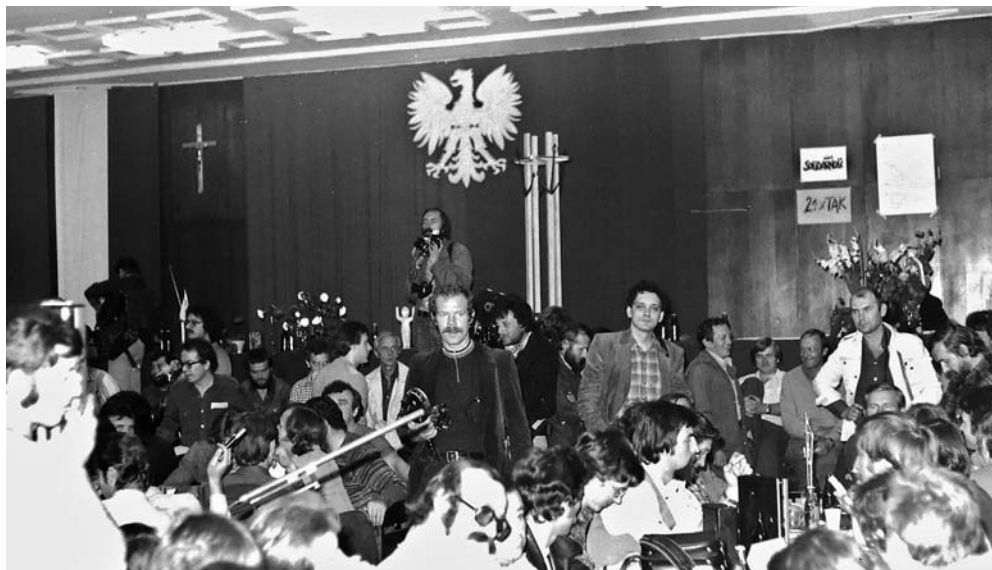
Sala BHP, delegaci zakładów zrzeszonych w MKS

wytwarzające żywność, Szybka Kolej Miejska. Zakłady te zadeklarowały przyłączenie się do strajku przez wywieszenie flag narodowych i noszenie przez załogi biało-czerwonych opasek 22 .