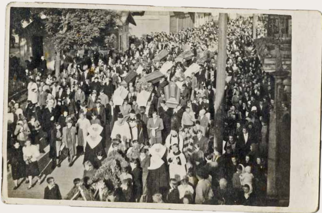
► Pogrzeb Polaków zamordowanych przez banderowców w lesie koło Lubyczy Królewskiej (woj. lwowski); Bełzec, czerwiec 1944 roku

Stopniowa zmiana nastawienia do „polskiego problemu” nastąpiła na przełomie lat 1943 i 1944, kiedy na Wołyniu pojawiła się Instrukcja kierownictwa OUN, polecająca traktować „polski front” jako drugorzędny, a w związku z tym – zalecano w „odwetowych” akcjach nie zabijać kobiet i dzieci. Dokument otwierał jednak furtkę pozwalającą kontynuować rzeź: „Likwidować [...] te polskie elementy, które aktywnie angażują się przeciwko ukraińskości”. UPA kontynuowała działania wymierzone w Polaków, co na początku 1944 roku spotkało się ze zdecydowaną kontrakcją 27. Wołyńskiej Dywizji Piechoty AK.