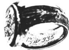
175 Mat. dow. - str. 26 pkt 20