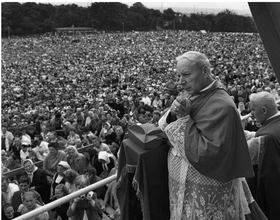
Prymas Polski w czasie głównych uroczystości milenijnych na Jasnej Górze, 15 sierpnia 1966 r.

by choć jeden chłopiec polski zginął, podniecony pewnością, że Moskale nie naruszą granic Polski. Już dziś prasa włoska i francuska podaje mapy Polski, otoczonej zewsząd tankami sowieckimi. Podają nawet ilość dywizji. W takiej sytuacji trzeba liczyć się z możliwością szalonego kroku, »by ratować ustrój socjalistyczny Bloku«, a raczej by nie stracić wygodnej linii strategicznej dla militarystyki moskiewskiej» 2 .