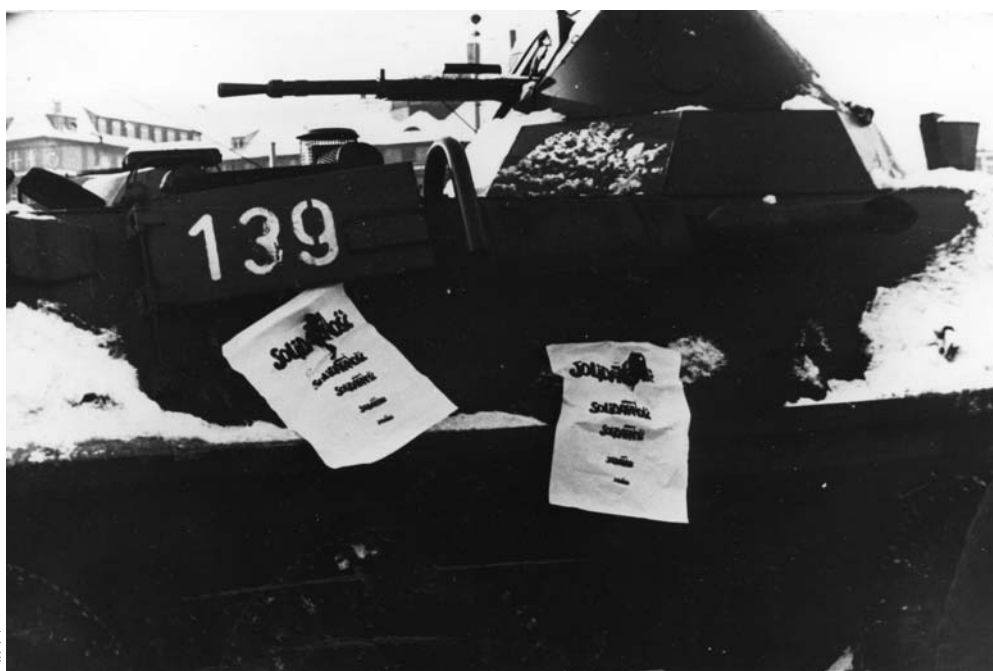
Z ulotkami przeciw transporterom

Działania SB wobec środowisk akademickich można podzielić na dwie grupy: pierwszą tworzą metody monitorowania stanu świadomości środowisk naukowych, drugą – mechanizmy selekcji i wspomagania karier zawodowych pracowników nauki. Monitorowanie oznaczało systematyczną inwigilację i gromadzenie charakterystyk pracowników nauki. Do selekcji i wspomagania karier zawodowych pracowników nauki używano okresowych ocen i przeglądów kadr organizowanych w latach osiemdziesiątych, po wprowadzeniu stanu wojennego. Sterowano wyjazdami naukowców na konferencje, sympozja i stypendia zagraniczne, do prowadzenia polityki personalnej według wskazań SB wykorzystywano kadry PZPR oraz tajnych współpracowników wśród dziekanów i dyrektorów.