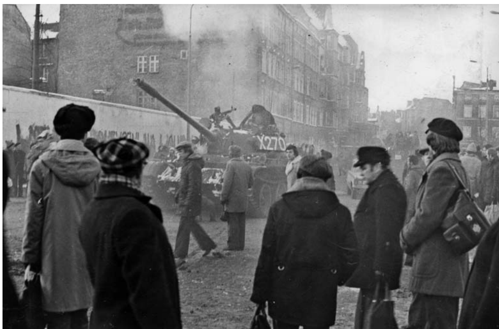
Demonstracje w Gdańsku: czołgi przeciw bezbronnym cywilom

„warunki”, a te stały się optymalne dopiero po 13 grudnia 1981 r. Pozwalały one przywrócić możliwie pełną władzę PZPR nad polskim społeczeństwem. Co więcej, dawały przywódcom PZPR czas i możliwości przygotowania przyszłych zmian systemowych tak, by w możliwie maksymalnym stopniu zapewnić establishmentowi PRL zarówno dostęp do realnej władzy, jak i bezpieczeństwo w nowej rzeczywistości. Dobrze wykorzystany przez władze PRL czas stanu wojennego sprawił, że dzisiaj Polakom trudno odnaleźć uzasadnienie dla wspólnego, narodowego pamiętania o tamtych tragicznych doświadczeniach.