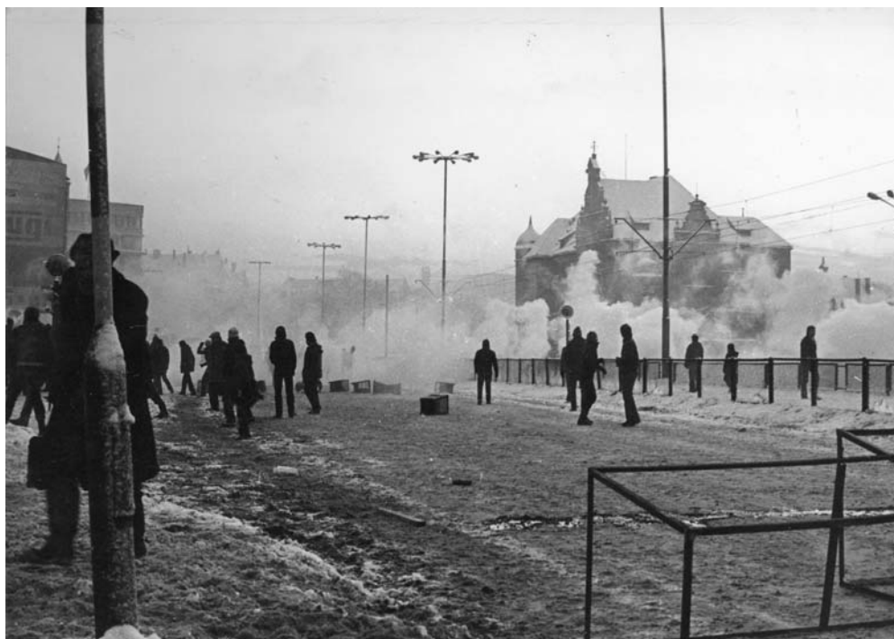
Starcia z milicją przed Dworcem Głównym w Gdańsku, 16 lub 17 grudnia 1981 r.

służb specjalnych nawet z seminariów i wydziałów teologicznych. Zdolni uczniowie i studenci byli przedmiotem szczególnego zainteresowania SB. Pozwalało to skutecznie pozyskiwać do współpracy (a także do pracy w Służbie Bezpieczeństwa) wielu ambitnych i zdolnych absolwentów szkół wyższych.