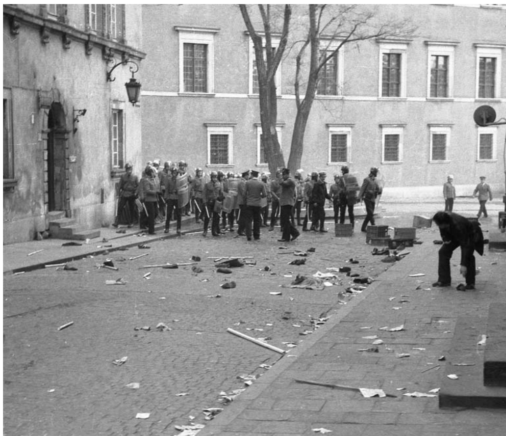
3 maja 1982 r.: po manifestacji w Warszawie w rocznicę uchwalenia Konstytucji 3 Maja

w III RP. Nadal trwa – może mniej dramatyczny niż dawniej, ale wciąż żywy – podział na zwolenników „mniejszego zła”, akceptujących stan wojenny, oraz jego zdecydowanych przeciwników przekonanych, że był zbrodnią wymagającą potępienia i osądzenia. Ten podział wprowadził do III RP destrukcyjną dla norm moralnych relatywizację i obojętność wobec zła, zdrady i przemocy stosowanej przez władzę wobec politycznych przeciwników.