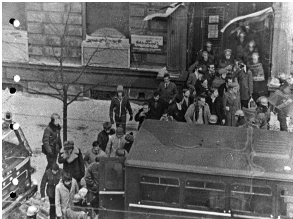
Milicjanci wyprowadzają działaczy i pracowników z siedziby Zarządu Regionu NSZZ „Solidarność” w Łodzi, 13 grudnia 1981 r.

zalecenie, by każdy nowy, ograniczony do jednego zakładu pracy związek rejestrował się w CRZZ 4 .