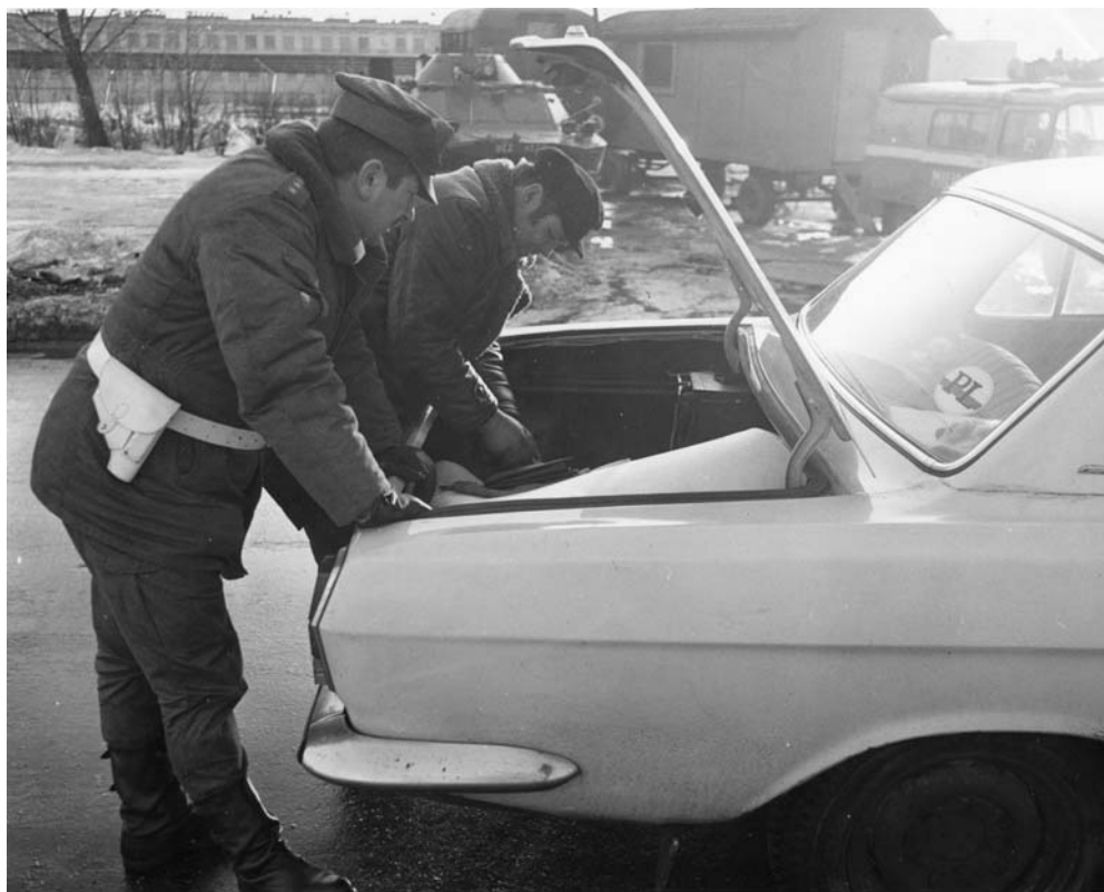
Łódź, funkcjonariusze MO przeprowadzają kontrolę pojazdu

hipotezą służył przygotowaniu ludzi, zadań, celów, instytucji i instrumentów dla procesu tzw. transformacji.