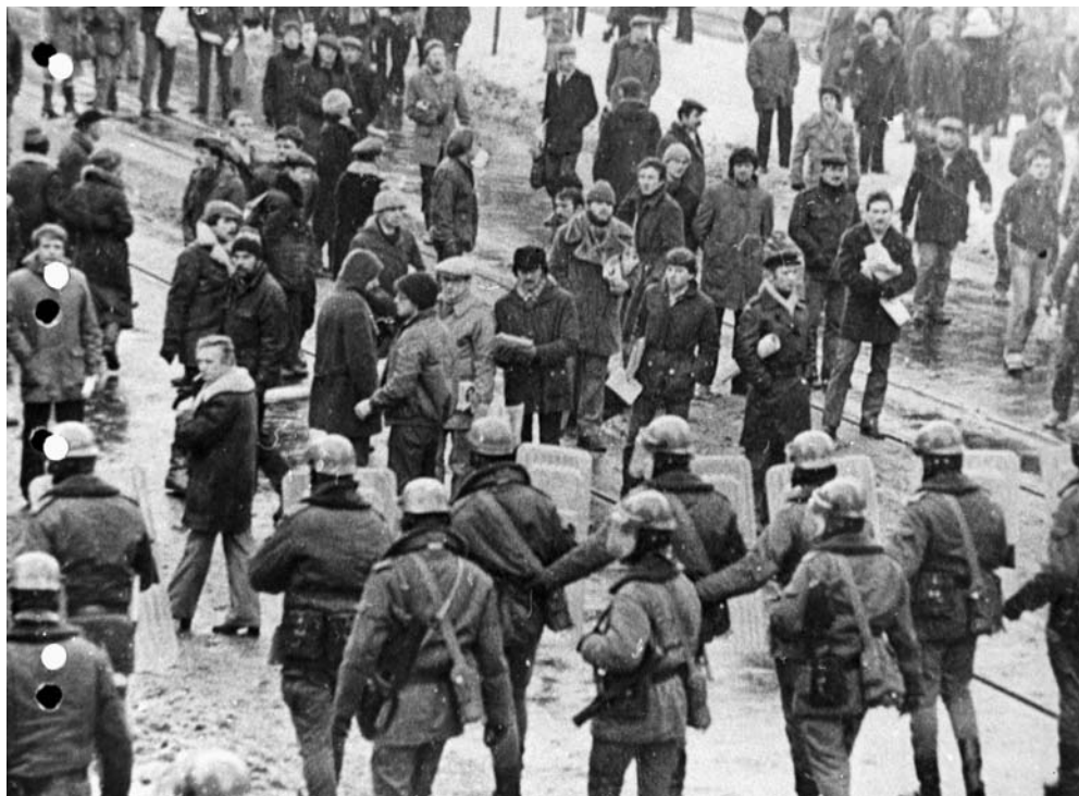
Oddział milicji usuwa ludzi z okolic siedziby Zarządu Regionu NSZZ „Solidarność” w Łodzi, 13 grudnia 1981 r.