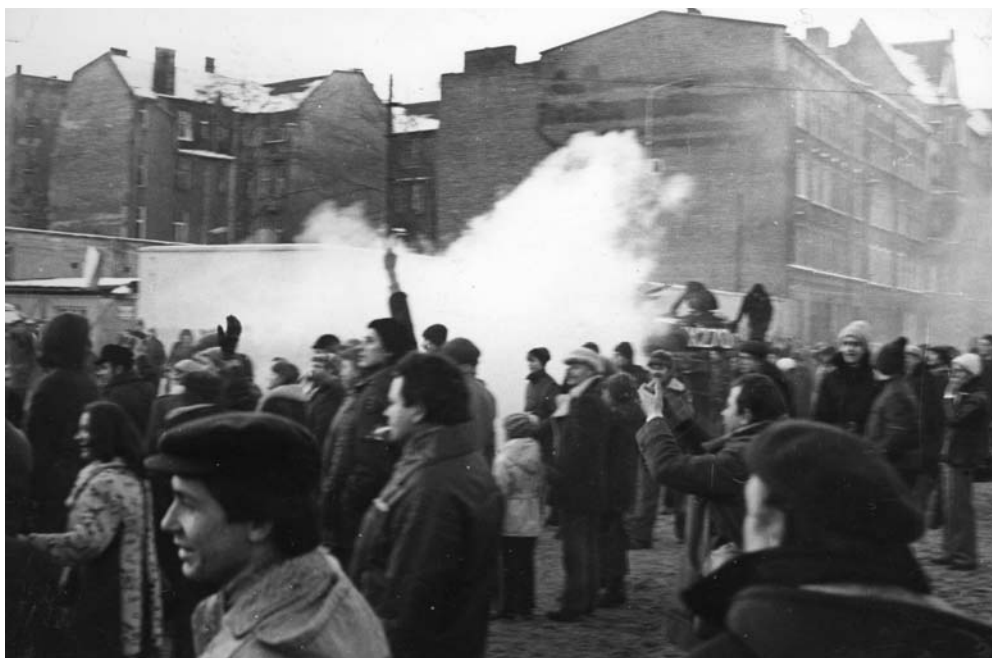
Grudzień 1981 r., manifestacja na ul. Jana z Kolna w Gdańsku

dziennikarzy oraz 1329 osób zatrudnionych w szkołach wyższych. Usunięto ze stanowisk kilkudziesięciu rektorów, dziekanów i dyrektorów instytutów naukowych. Za sympatię do „Solidarności” odwołano dziesiątki sędziów i prokuratorów 6 .