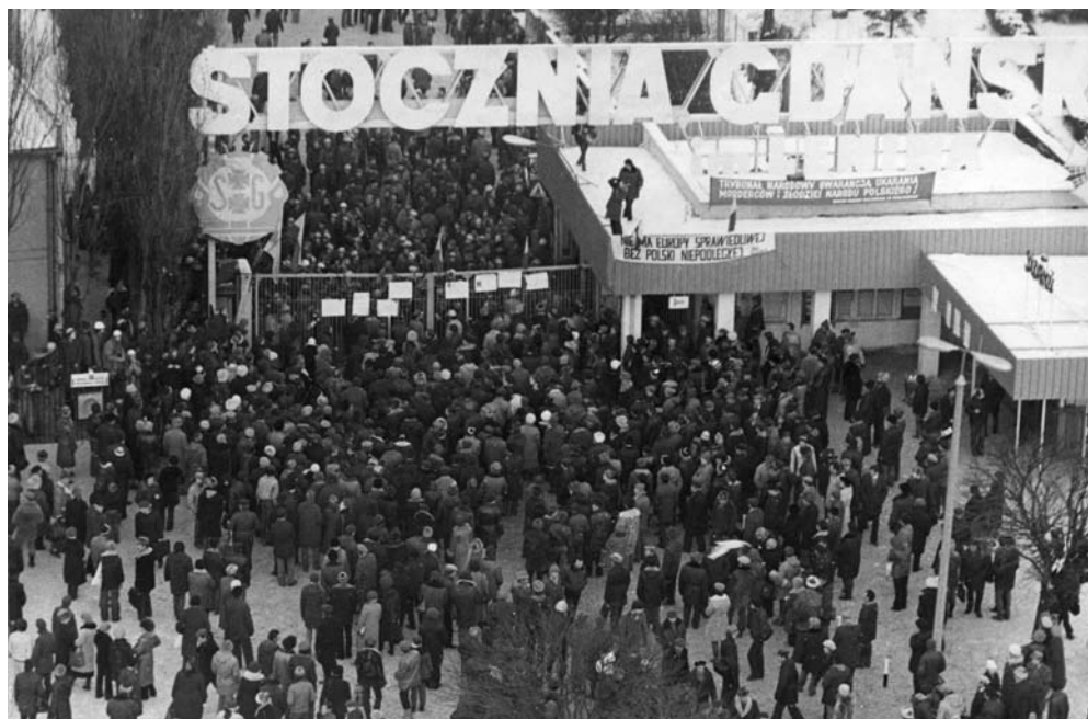
Tłumy demonstrantów przed Stoczną Gdańską, 16 lub 17 grudnia 1981 r.

Musiał napisać, że o ile w 1973 r. pion SB w MSW miał do dyspozycji 14 992 etaty, o tyle w 1981 r. – 20 086, a w 1985 – już 25 643. Ten wzrost uzasadniany jest przez historyków i politologów, co oczywiste, rosnącymi wpływami opozycji. Jednak zwiększanie liczby funkcjonariuszy służb specjalnych dowodzi także, że rosnące wpływy opozycji traktowano nie tyle jak merytoryczny problem wymagający systemowego rozwiązania, lecz jako problem „do likwidacji”. Interesujące, że po czerwcowych wyborach 1989 r., formalnie rzecz biorąc, pion SB w MSW gwałtownie skurczył się do 7821 etatów 7 . Oznacza to, że mechanizm weryfikacji pracowników SB został u początku III RP znacznie ograniczony liczbowo i trudno uwierzyć, że nie został zaplanowany, by zapewnić byłym esbekom bezpieczeństwo w nowej sytuacji politycznej.