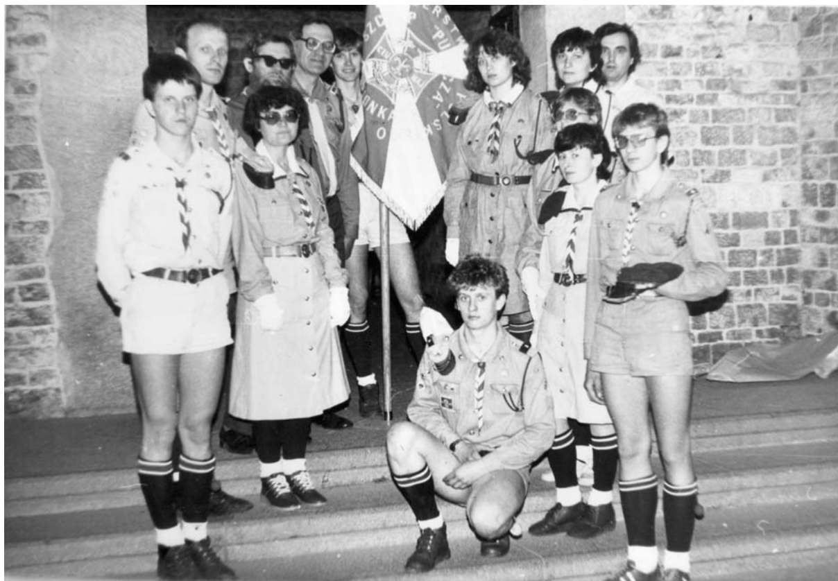
Uroczystość konspiracyjnego poświęcenia sztandaru Szczepu Drużyn Środowiskowych „Puszcza” z Pionek (Hufiec ZHP Pionki); krypta Marszałka Józefa Piłsudskiego na Wawelu, 3 maja 1987 r.

rozbieżność opinii w kluczowych kwestiach 20 . Ostatecznie, 13 maja 1989 r. doszło do powołania Komisji Krajowej, jako władzy centralnej tej organizacji, obok dalej istniejącej KRK. Część regionów poparła KK, co oznaczało jawny rozłam. Równocześnie na arenie politycznej dało się zaobserwować marginalizację FMW, która nie potrafiła zająć jednolitego stanowiska wobec wyborów parlamentarnych w czerwcu 1989 r. Komisja Krajowa wzywała do ich zdecydowanego bojkotu, natomiast inne środowiska pozostawiały tę kwestię osobistemu wyborowi członków. Federacja jako całość traciła zatem poparcie kierownictwa „Solidarności”, a wkrótce nowego rządu Tadeusza Mazowieckiego. Młodzi opozycjoniści, a raczej znaczna ich część, nie chcieli zaakceptować nowej rzeczywistości politycznej, której sednem był kompromis zawarty z komunistami, a co za tym idzie – polityka ustępstw wobec nich 21 .