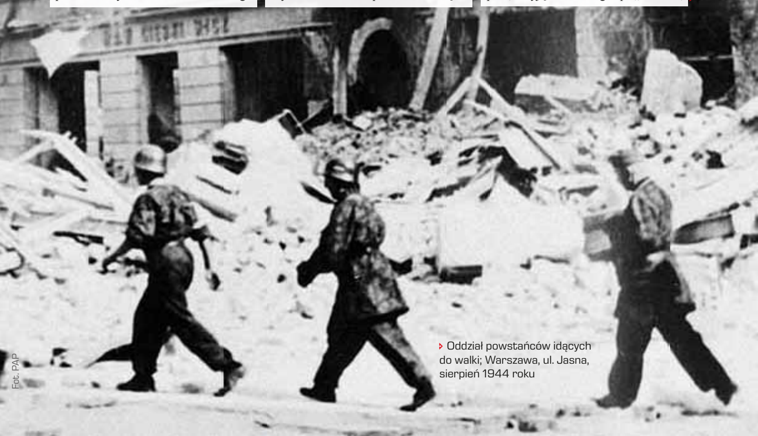
▶ Oddział powstańców idących do walki; Warszawa, ul. Jasna, sierpień 1944 roku

Na skutek zatoru spowodowanego przez rannych i cywilów przygotowujących się do przejścia do Śródmieścia oddziały ppłk. „Radosława” i mjr. „Sosny” osiągnęły pozycje wyjściowe dopiero ok. 1.00 w nocy. Wobec niepowodzenia na pl. Bankowym rezultatem tego opóźnienia było zmarnowanie większości i tak krótkiej nocy oraz utrata elementu zaskoczenia. Ostatecznie natarcie rozpoczęło się dopiero ok. 3.00 nad ranem. Pierwszy zaatakował kilkudziesięciosobowy oddział kpt. „Trzaski”, któremu za cenę znacznych strat udało się sforsować ul. Bielańską, jednakże w skutek silnego niemieckiego oporu i wysokich strat grupa ta, z wyjątkiem samego kpt. „Trzaski”,