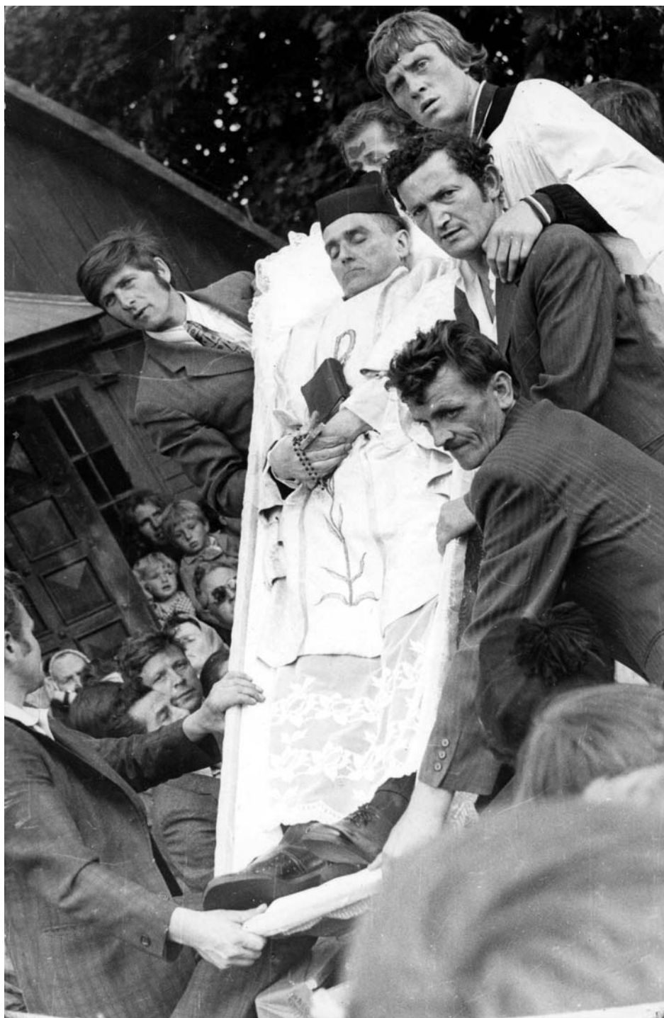
Wystawienie trumny na widok publiczny podczas pogrzebu ks. Romana Kotlarza