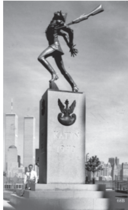
Pomnik „Katyń 1940” w Jersey City, fot. W. Naczas, zdjęcie udostępnił autorce albumu twórca pomnika A. Pityński

Alina Siomkajto, Katyń w pomnikach świata /Katyń: Monuments around the World (Agencja Wydawnicza CB, Oficyna Wydawnicza Rytm, Warszawa 2002, s. 342 i nlb., 216 ilustracji (i nlb. „b”, „c” itd.), mapy, jęz. polski, spis treści ang.)