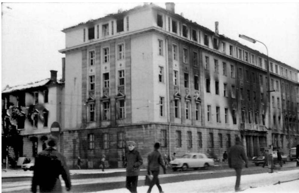
Wypalony gmach KW PZPR w Gdańsku

zarobków o 30 proc.; obniżki cen za artykuły spożywcze do norm sprzed trzech lat; nieobcinania norm pracy; wolności słowa i wyznania zgodnie z konstytucją i inne. Jednocześnie ogłaszając strajk okupacyjny na razie na okres 24 godzin. W czasie trwania omawianego wiecu ruszyła grupa zebrana na drodze do bramy nr 2. Po paru minutach w rejonie bramy nr 2 rozległa się seria wystrzałów, a następnie z tego kierunku przybiegł jeden z pracowników, ogłaszając przez megafon, że wojsko strzela i prawdopodobnie są ranni i zabici 41 .