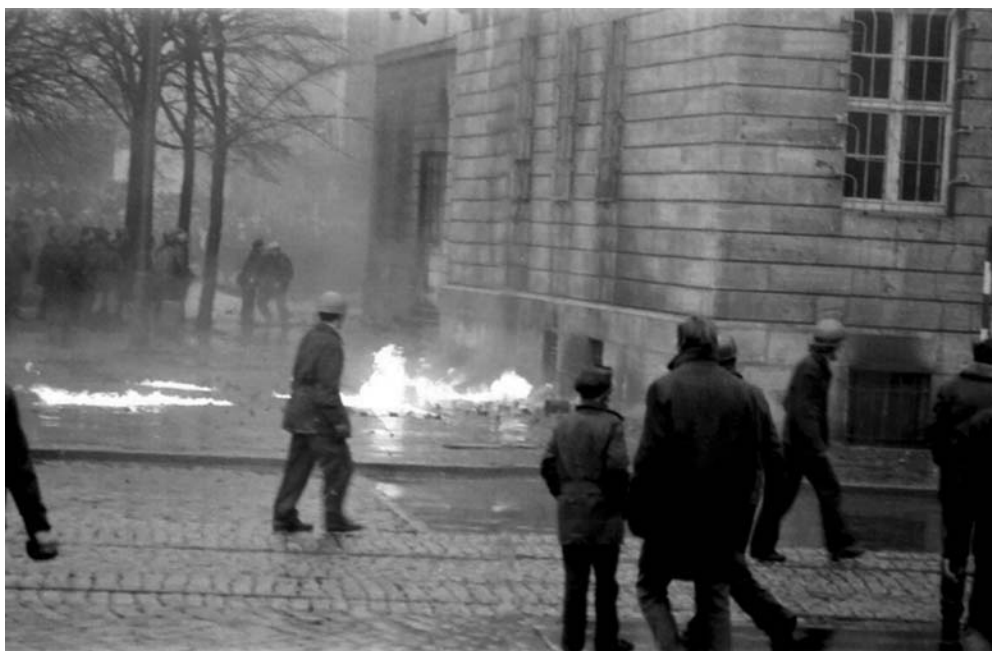
Przy KW PZPR w Gdańsku, 15 grudnia 1970 r.