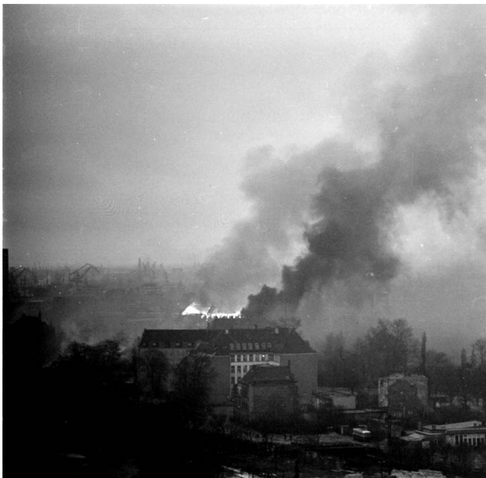
Płonący gmach Komitetu Wojewódzkiego PZPR w Gdańsku, 15 grudnia 1970 r.

logiczne zarządzenie „w sprawie zapewnienia porządku i bezpieczeństwa publicznego” wydał szef resortu spraw wewnętrznych gen. Kazimierz Światała. Powołano sztaby wojewódzkie oraz Centralny Sztab MSW z kierownikiem – komendantem głównym Milicji Obywatelskiej i wiceministrem spraw wewnętrznych gen. Tadeuszem Pietrzakiem na czele. W tym samym dniu Centralny Sztab MSW opracował Plan przedsięwzięć związanych z akcją „Jesień 70” . W jednostkach MSW 11 grudnia 1970 r. ogłoszono stan pełnej gotowości bojowej 9 .