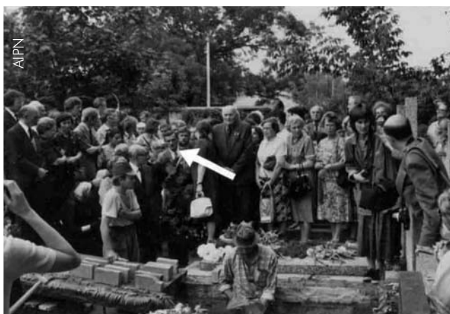
Na zdjęciu zaznaczony przez SB Zbigniew Romaszewski