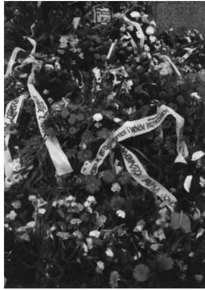
Wieńce od opozycjonistów