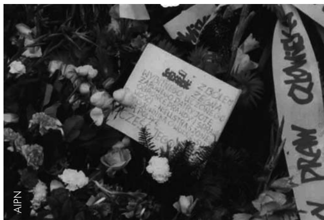
Pożegnanie od podziemnej „Solidarności”