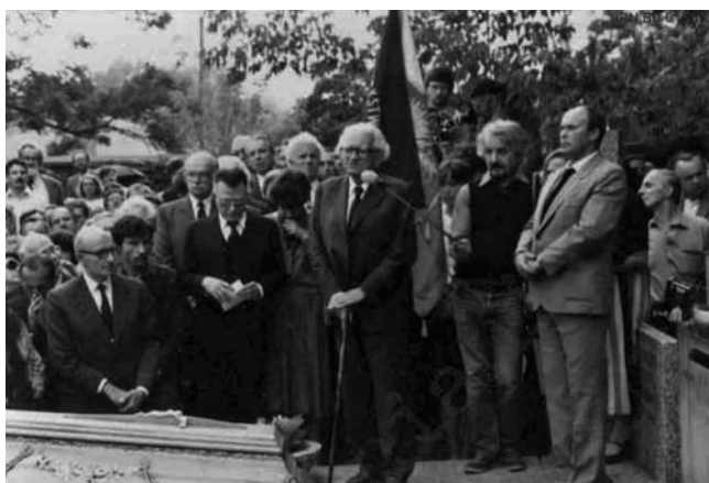
Przemawia prof. Czesław Bobrowski