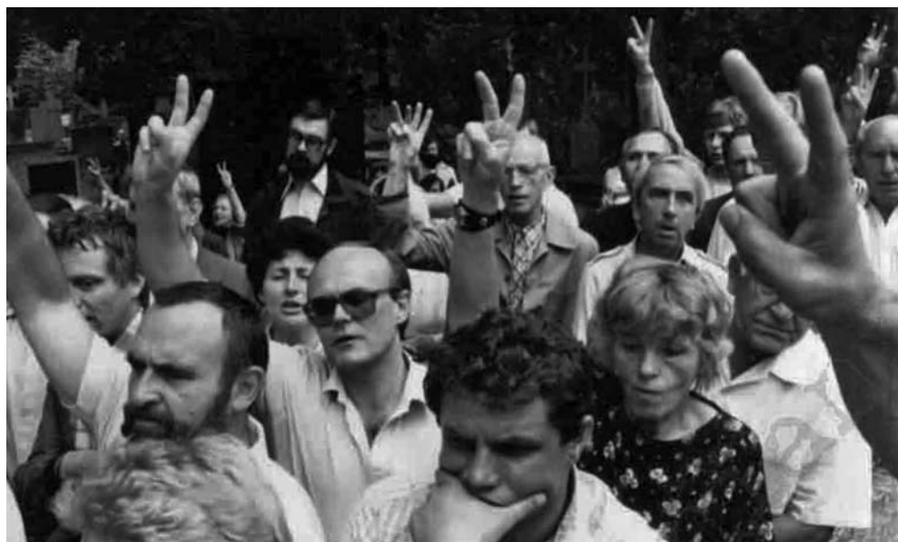
Chwila śpiewania pieśni Boże coś Polskę