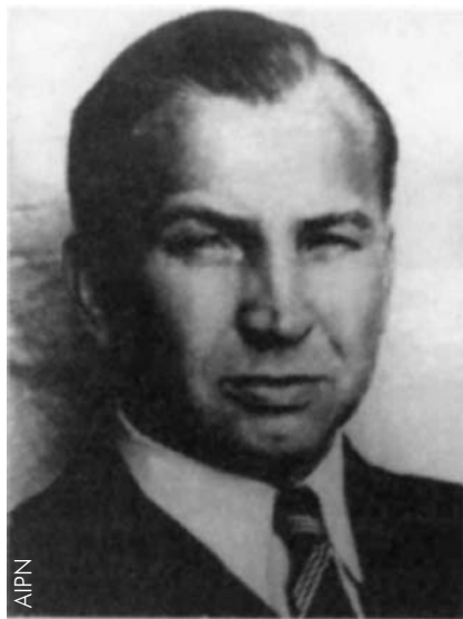
Gen. Leopold Okulicki

Straty AK oblicza się na ok. 60 tys. żołnierzy (15,79 proc.). Co ciekawe, w lipcu 1944 r. Sztab Naczelnego Wodza w Londynie oceniał „zasoby ludzkie” w kraju na 9 tys. oficerów i 150 tys. szeregowych (uwzględniano roczniki poborowe). Zamierzano sformować z nich trzy dywizje piechoty, dziesięć dywizji terytorialnych oraz dziesięć baonów czołgów 17 .